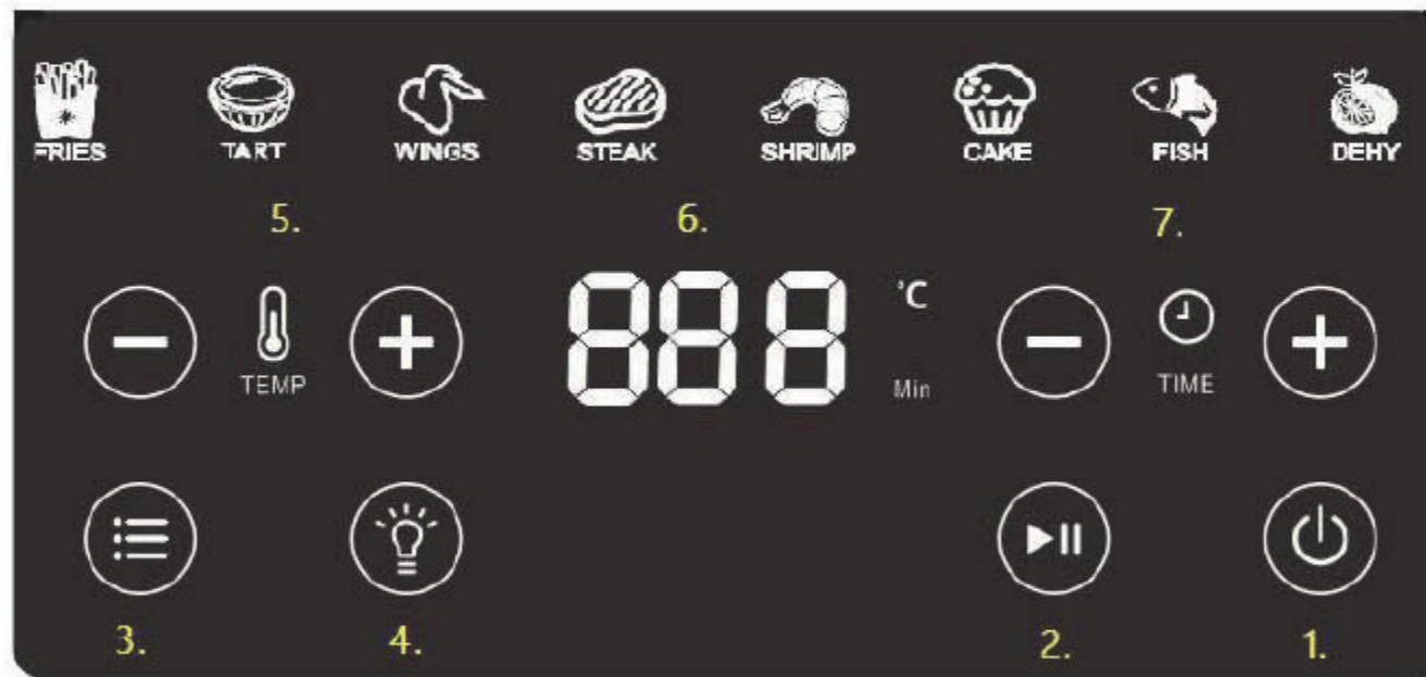
Figur 2. Display

Du finder kontrolpanelet på forsiden af Wartmann airfryeren. Det er et display med en touchskærm. Ved at trykke på de forskellige knapper (ikoner) kan du betjene Wartmann airfryeren.